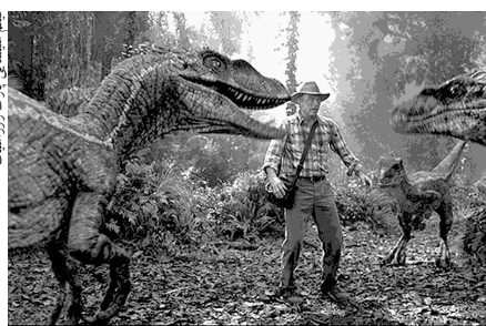
فيلم سينماژ يارک ژوراسيک