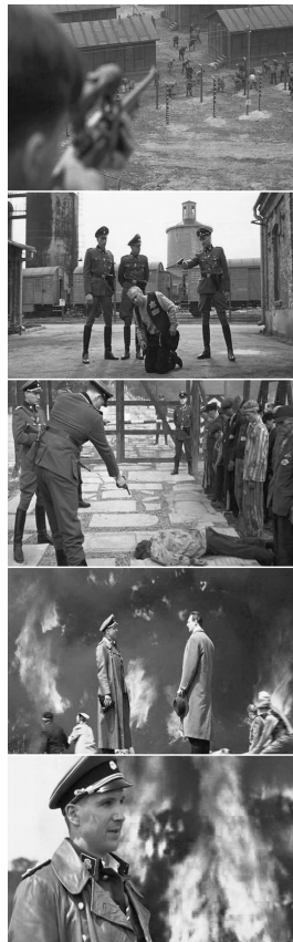
فهرست سینماژ اسپیلبرگ