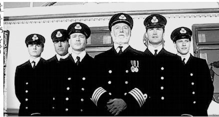
فيلم سينماژ نايتليک