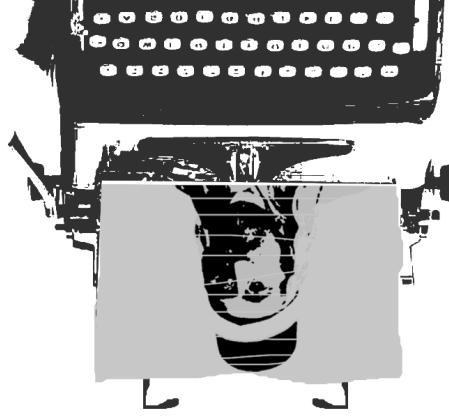
ایجاد جاذبه‌های گردشگری در جایگاه بهائیان / حیفا