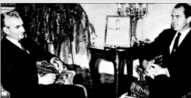
شاه ایران در کنار نیکسون رئیس‌جمهور آمریکا

پس از فروپاشی اتحاد جماهیر شوروی و زوال جریان چپ در منطقه، خلا نسخه اسلامی و پیراسته از التقاط اقتصاد و رخنه دگراندیشان خودباخته در ارکان تصمیم‌سازی اقتصادی در داخل و یکه تازی لیبرالیسم با شعار نظم نوین جهانی در خارج، فرصت دوباره‌ای برای دلشدگان نسخه‌های غیر بومی فراهم آورد تا تئوری «توسعه» را تنها گفتمان حاکم اقتصادی دوران سازندگی کنند.