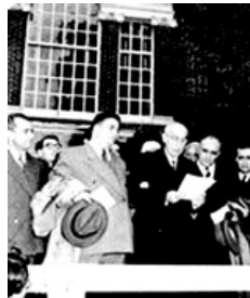
رهبر حزب زحمتکشان

وقتی آنها در یک روزنامه یا یک مقاله اظهار نظری می‌کنند، همه باید قبول کنند، اینها سکوت کردند! این قدر اینها از متن مردم دور بودند و این دوری همچنان ادامه پیدا کرد. گاهی نشانه‌های خیلی کوچکی از روشنفکران پیدا می‌شد؛ اما وقتی که دستگاه یک تشر می‌زد، برمی‌گشتند، می‌رفتند! یکی از نمونه‌های جالبش، آدم معروفی بود که چند سالی است فوت شده است - حالا نمی‌خواهم اسمش را بیاورم؛