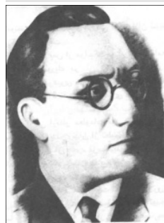
تقی آران/ مؤسس حزب توده

و بسیاری از رجال قاجار که جزو روشنفکران بودند. یعنی درست مواضع جا به جا شده بود؛ اما در عین حال، مبارزه با دین خرافاتی مسیحیت، در روشنفکری ایران، جای خودش را به مبارزه با اسلام داد! بنابراین، یکی از خصوصیات روشنفکر این شد که با اسلام، دشمن و مخالف باشد. البته هنوز هم که هنوز است، دنباله‌های همان خیل روشنفکران دوره پهلوی، از کتاب نویس‌شان گرفته، تا شاعرشان، تا محقق‌شان، تا مصحح‌شان، تا بیوگرافی نویس‌شان، گاهی با صراحت همان خط را دنبال می‌کنند و از مثل «میرزا فتحعلی آخوندزاده» ای، آن‌چنان تجلیل می‌کنند که گویی از پیامبری تجلیل می‌کنند! برای این که میرزا فتحعلی به برکت ضدیتش با دین و مبارزه‌اش با اسلام، هم رفت سر سفره تزارها نشست و نان آنها را خورد و کمک آنها را قبول کرد و هم بعداً وقتی که بلشویک‌ها و کمونیست‌ها به خامنه ما آمدند، به نام میرزا فتحعلی آخوندزاده کنسرت راه انداختند! من خودم چون در آن دوران،