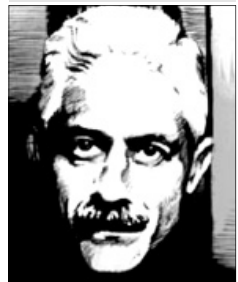
جلال آل احمد

حرکت و تلاش دارند؛ اما روشنفکر - که در آن نمایشنامه «آقای بالای ایوان» نام دارد - به کل برکنار می‌ماند! من همان وقت در مشهد، بعد از نماز برای دانشجویان و جوانان صحبت می‌کردم؛ این کتاب به دست ما رسید، من گفتم که خود این آقای نویسنده کتاب هم، همان «آقای بالای ایوان» است! در حقیقت خودش را تصویر و توصیف کرده است؛ به کلی برکنار!