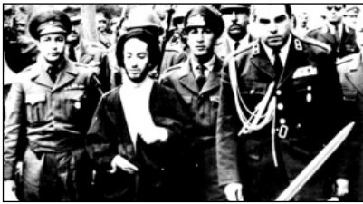
شهید نواب صفوی

زندان‌ها از مردم، از روحانیون، از دانشجویان، از طلبه‌ها، از آحاد مردم، از کارگر و از کاسب پر بود. این چهره‌های معروفی که همه می‌شناسید، زندان رفتند و ساعت‌های متممادی زیر شکنجه فریاد کشیدند؛ اما آن آقایان روشنفکر، نه!