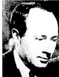
نورالدین کیانوری / آخرین رهبر حزب توده ایران

باشد. جالب اینجاست که وقتی قید عدم تعبد را جزو قیود حتمی و اصلی روشنفکری ذکر می‌کنند، نتیجه این می‌شود که علامه طباطبایی، بزرگ‌ترین فیلسوف زمان ما که از فرانسه، فلاسفه و شخصیت‌های برجسته‌ای مثل «هانری کربن» به اینجا می‌آیند و چند سال می‌مانند تا از او استفاده کنند، روشنفکر نیست؛ اما مثلاً فلان جوجه شاعری که به مبانی مذهب و مبانی سنت و مبانی ایرانی‌گری اعتقادی ندارد و چند صباحی هم در اروپا یا آمریکا گذرانده، روشنفکر است؛ و هرچه در اروپا بیشتر مانده باشد، روشنفکرتر است! ببینید چه تعریف غلط و چه جریان زشت و نامناسبی به نام روشنفکر در ایران ایجاد شده بود!