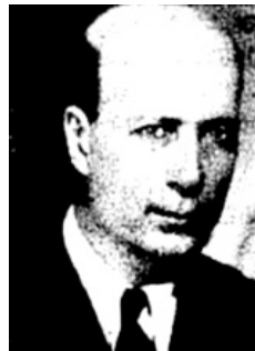
پیشهوری/عضو حزب توده