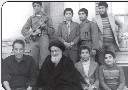
آیت‌الله شهید سیداسدالله مدنی

آتش کینه منافقین، شیعه و سنی و مسیحی و ... نمی‌شناسد. این گروهک تروریستی جهت رسیدن به هدف شوم خود، همه انسان‌ها را از هر دین و مسلکی قربانی می‌کند. در این بین بهترین گواه، ترور ملامالح خسروی، روحانی مبارز اهل سنت است.