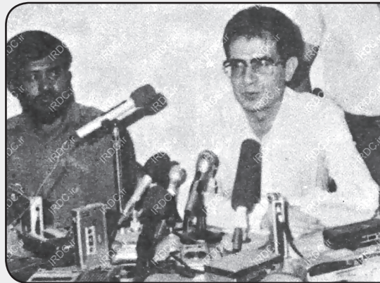
حسن آیت در حال مصاحبه مطبوعاتی پس از انتشار روزنامه انقلاب اسلامی مبنی بر طرح توطئه

۱۴ مرداد: منافقین، یکی دیگر از یاران امام و انقلاب را هدف قرار دادند و این بار کسی نبود جز دکتر حسن آیت. وی سال ۱۳۱۷ در نجف‌آباد اصفهان دیده به جهان گشود و پس از اخذ دیپلم، وارد دانشگاه شد و در رشته‌های ادبیات و روزنامه‌نگاری و حقوق، مدرک کارشناسی و در علوم اجتماعی مدرک کارشناسی ارشد و سپس دکترای علوم انسانی را دریافت نمود. دکتر آیت در آغاز نهضت اسلامی، در ارتباط با چاپ و پخش اعلامیه‌های امام خمینی ره