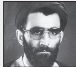
حجت‌الاسلام و المسلمین کامیاب