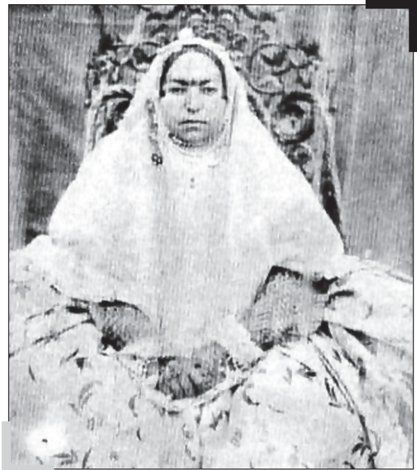
مهدعلیا، همسر محمدشاه و مادر ناصرالدین‌شاه قاجار است که پس از به سلطنت رسیدن شوهرش، لقب مهدعلیا یافت.

«پلنگ سیاه» شاید یکی از شایسته‌ترین القابی است که از سوی روزنامه‌های اروپایی به اشرف پهلوی، خواهر همزاد محمدرضا پهلوی داده شده است. او برخلاف برادر تاجدارش، روحیه‌ای غیر متزلزل و مقتدرانه داشت. «ژراردو ویلیه» در شرح خصوصیات و