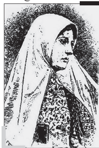
وی خلیجی از وی است. هر که گفته نشده و یا نقلی نشده است. بنابر این تمامی تصاویر موروثی از وی که در تصویر فرقه‌العین، هیچ تصویری از طاهره در زمان وجود او وجود ندارد.

فاطمه، ملقب به «قره‌العین» و «طاهره» و موصوف به «بدرالدجی» و «شمس الضحی» در خاندانی مجتهدپرور در شهر قزوین به دنیا آمد. او پس از طی مراحل ترقی علمی، بعدها به ازدواج پسر ملامحمدتقی