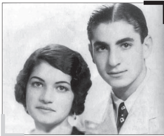
اشرف پهلوی و برادرش محمدرضا

او پس از مرگ شوهرش، وقتی دریافت عده‌ای در صدد به سلطنت رساندن عباس میرزا، پسر دیگر محمدشاه از همسر دیگرش به نام خدیجه هستند، به تکاپو افتاد تا به هر طریق ممکن سلطنت ناصرالدین شاه را مسجل سازد و در این راه با دسیسه و فتنه‌گری‌های خاص خود، موفق شد. او در دوران سلطنت ناصرالدین شاه یک حکومت مستقل و جاه‌طلبانه در درون حکومت فرزندش تشکیل داد و خود مستقلاً حکمرانی می‌کرد، اما با آغاز صدراعظمی میرزا تقی‌خان امیرکبیر، دوران خیره‌سری و اقتدارطلبی مهدعلیا به پایان رسید. برخوردار امیرکبیر با کانون قدرت مهدعلیا، از همان اوان صدارتش آغاز شد؛ چرا که از جمله اقدامات مهم امیرکبیر، کاستن