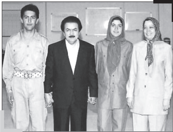
از راست: مریم عضدانلو (رجوی)، اشرف ابریشمچی (دختر مریم عضدانلو و مهدی ابریشمچی)، مسعود رجوی، مصطفی رجوی (پسر مسعود و اشرف ربیعی)

«من هم مثل سایر خواهران و برادرانم به وسیله خود مسعود متولد شدم... باور کنید هر مجاهدی که به رهبری مسعود گروید، به طور ایدئولوژیک یک «رجوی» است.»