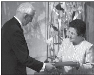
در سال ۲۰۰۳ کمیته جایزه نوبل در نروژ به شیرین عبادی جایزه صلح نوبل را اعطا کرد.

سخنگوی کاخ سفید و سخنگوی وزارت امور خارجه ایالات متحده ضمن تبریک به عبادی، بر موضوع «مسلمان بودن» وی تأکید کردند. این در حالی بود که خانم عبادی بارزترین شاخصه یک زن مسلمان یعنی حجاب را رعایت نمی‌کرد.