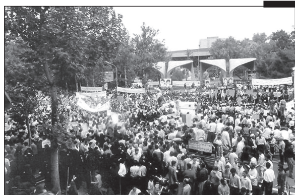
حمله ۲۳ تیر ماه سال ۷۸

بدون هیچ‌گونه تردید، در آن مقطع دگرگونی نظام اسلامی را پی می‌گرفت که البته با حضور جوانان مؤمن و انقلابی و در قالب نسل سوم که همگی به دست توانای مقام معظم رهبری و در دوران بسترسازی فتنه تربیت شده بودند، خنثی شد و در واقع انقلاب سوم و با موجی به مراتب قوی‌تر و گسترده‌تر از دو انقلاب قبلی و با بصیرت و آگاهی جامع نسبت به نظام ولایی، در چهارشنبه ۲۳ تیرماه ۷۸ شکل گرفت. در واقع راهپیمایی ۲۳ تیرماه ۷۸ اعلام حضور نسل سومی‌های انقلاب بود که در مقابل موج فتنه و هتاک و پرده‌دری اصحاب فتنه از یکسو و یأس و ناامیدی خواص جبهه حق، پا به میدان دفاع از ولایت و ارزش‌ها و دستاوردهای انقلاب اسلامی گذاشته بودند و